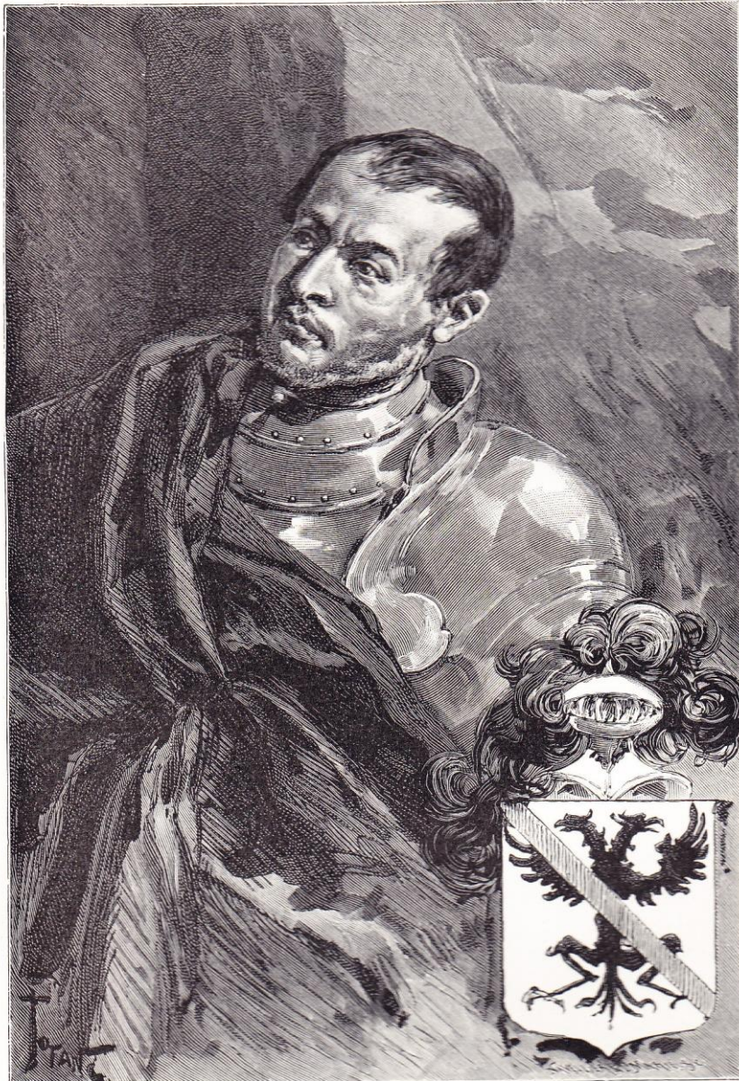
BERTRAND DU GUESCLIN